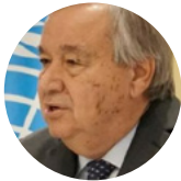
Antonio Guterres - Secrétaire général des Nations unies

... Nous entendrons des représentants de l'ONU et du gouvernement :