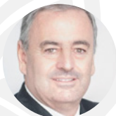
Ariel Guarco - Président de l'ACI et Président de la Confédération Coopérative de la République d'Argentine (COOPERAR)

... ceux qui dirigent le mouvement coopératif :