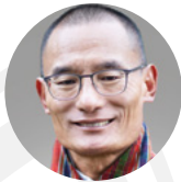
Tshering Tobgay - L'Honorable Premier ministre du Bhoutan