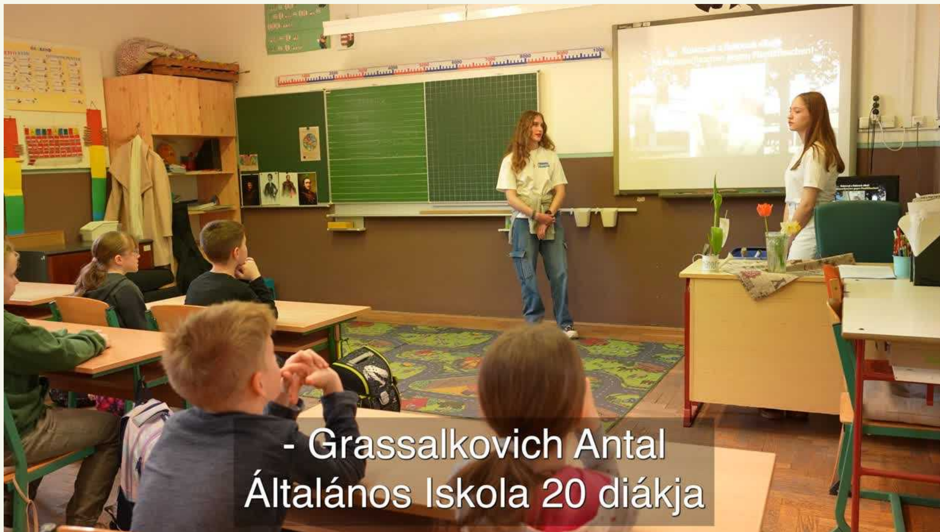
- Grassalkovich Antal Általános Iskola 20 diákja