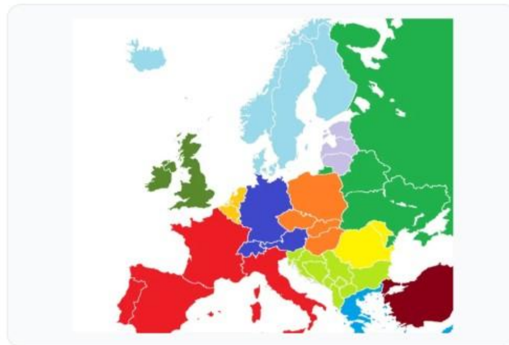
Európai szakképzési hálózat (Erasmus+ KA2)

Célkitűzés: Transznacionális tudásmegosztás és egységes európai tananyag kidolgozása a szőlőmetszés és szőlészeti szakképzés területén.