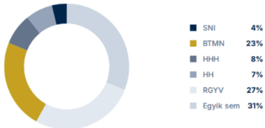
Sérülékeny diákok iskolai aránya